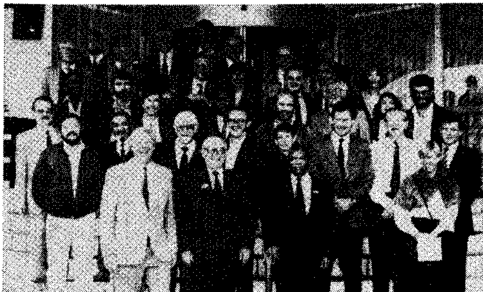
De drie delegaties in Leverkusen