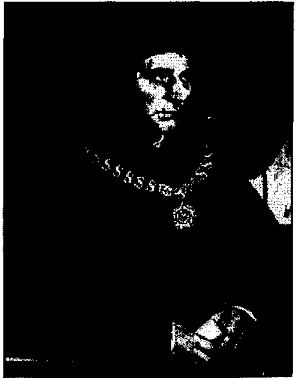
Sir Thomas More: zijn Utopia was een satire

De religieuze interpretatie van de utopie. Niet alle schrijvers van utopische verhalen zijn utopisten. Het was Thomas More die met zijn 'Utopia' (1516) het genre van de utopische vertelling een naam en een vaste