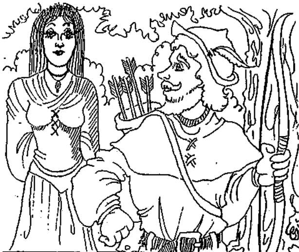
"OF COURSE WE ONLY ROB THE RICH! AFTER THE TAX COLLECTOR FINISHES WITH THEM, THE POOR HAVE NOTHING LEFT TO STEAL..."

De tegenstelling tussen deze twee opvattingen is radicaal. De gevolgtrekkingen uit de ene stelling wijken steeds meer af van deze uit de andere. Sta mij dus toe dat ik het probleem heel precies omschrijf.