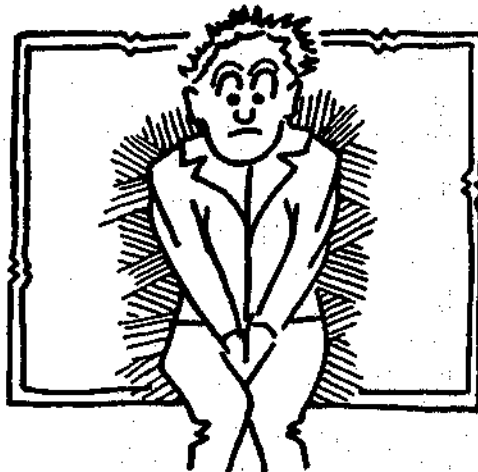
Het individu geraakt meer en meer in de knel.

Het NBC is een volgende mogelijkheid om het individu steeds meer in de knel te krijgen. Een uitstekend artikel, geschreven door dr. H.T.C. Godschalk, verscheen hierover onder bovengenoemde kop in " KNO info " van december 1983. Belangstellenden kunnen een gratis exemplaar aanvragen bij: KNO, Postbus 125, 7000 AC Doetinchem, NL.