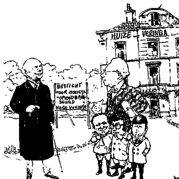
„U kunt ze alle drie weer mee naar huis nemen, mijnheer Den Uyl. U heeft er geen kind meer aan.”