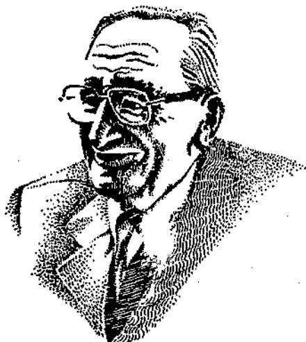
Friedrich A. Hayek, 1899 -

Het Libertarisch Boekcentrum Beethovenlaan 25, 2102 ES HEEMSTEDENLD. Tel: 023-290941.